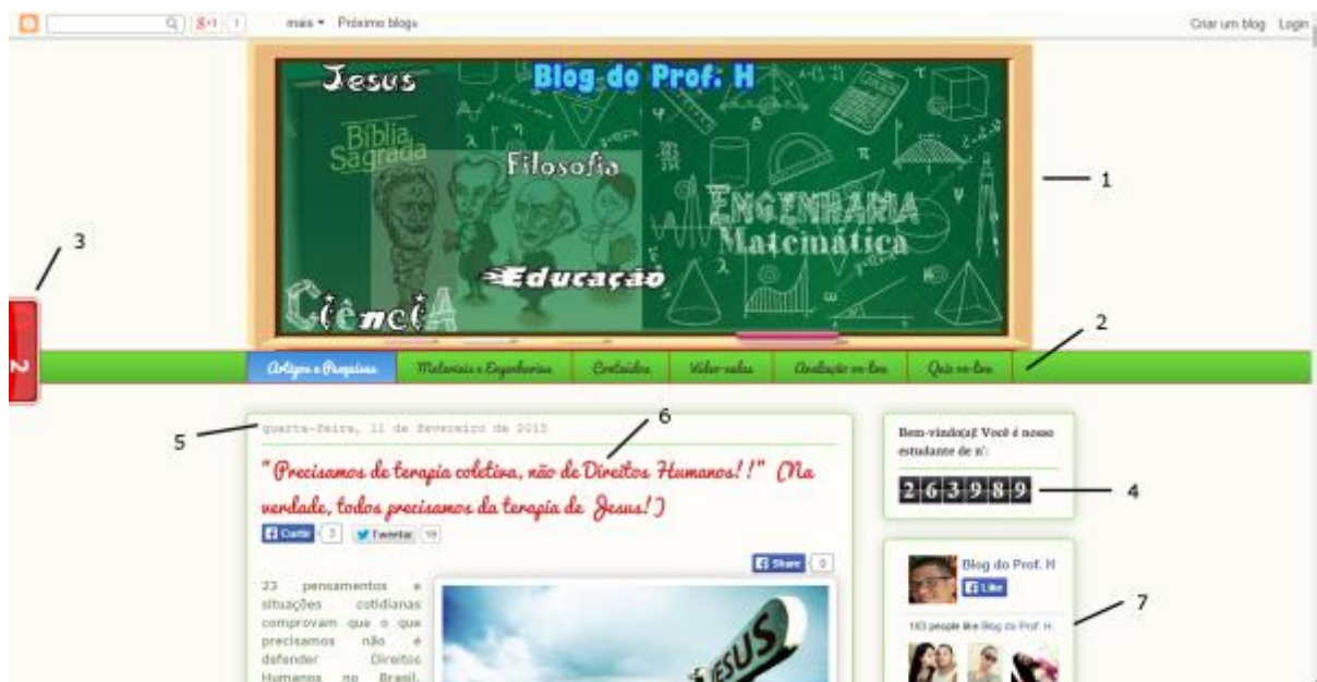
Figura 1: Um blog , seus recursos, suas funcionalidades e aplicações para o treinamento da tutoria online .