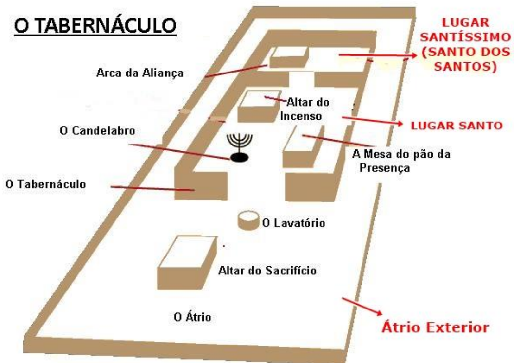
Figura 2 Um modelo ou sombra do Santuário Celestial

24Cristo não entrou num Lugar Santo feito por seres humanos, que é a cópia do verdadeiro Lugar. Ele entrou no próprio céu, onde agora aparece na presença de Deus para pedir em nosso favor.